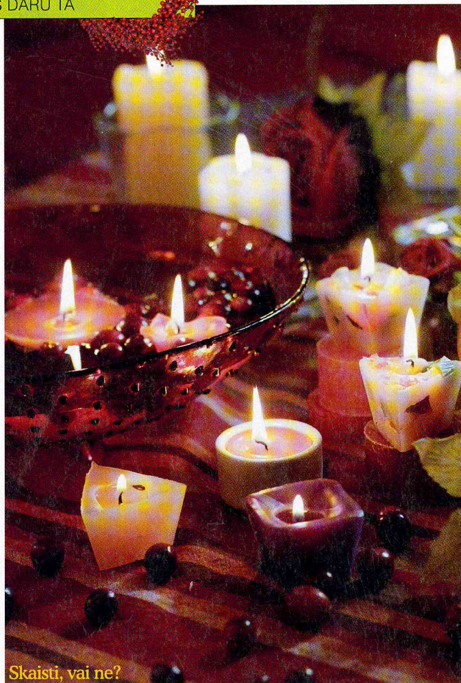
Skaisti, vai ne?